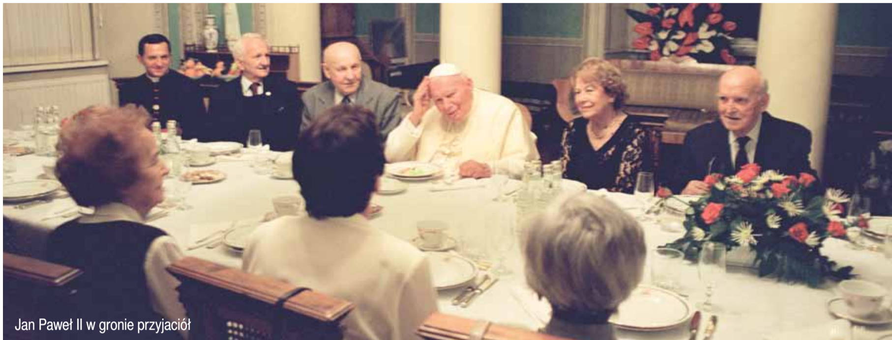
Jan Paweł II w gronie przyjaciół